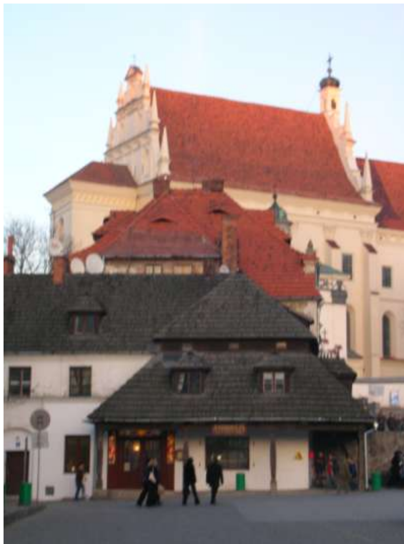
MIASTO ZABYTKOWE – KAZIMIERZ DOLNY NAD WISŁĄ