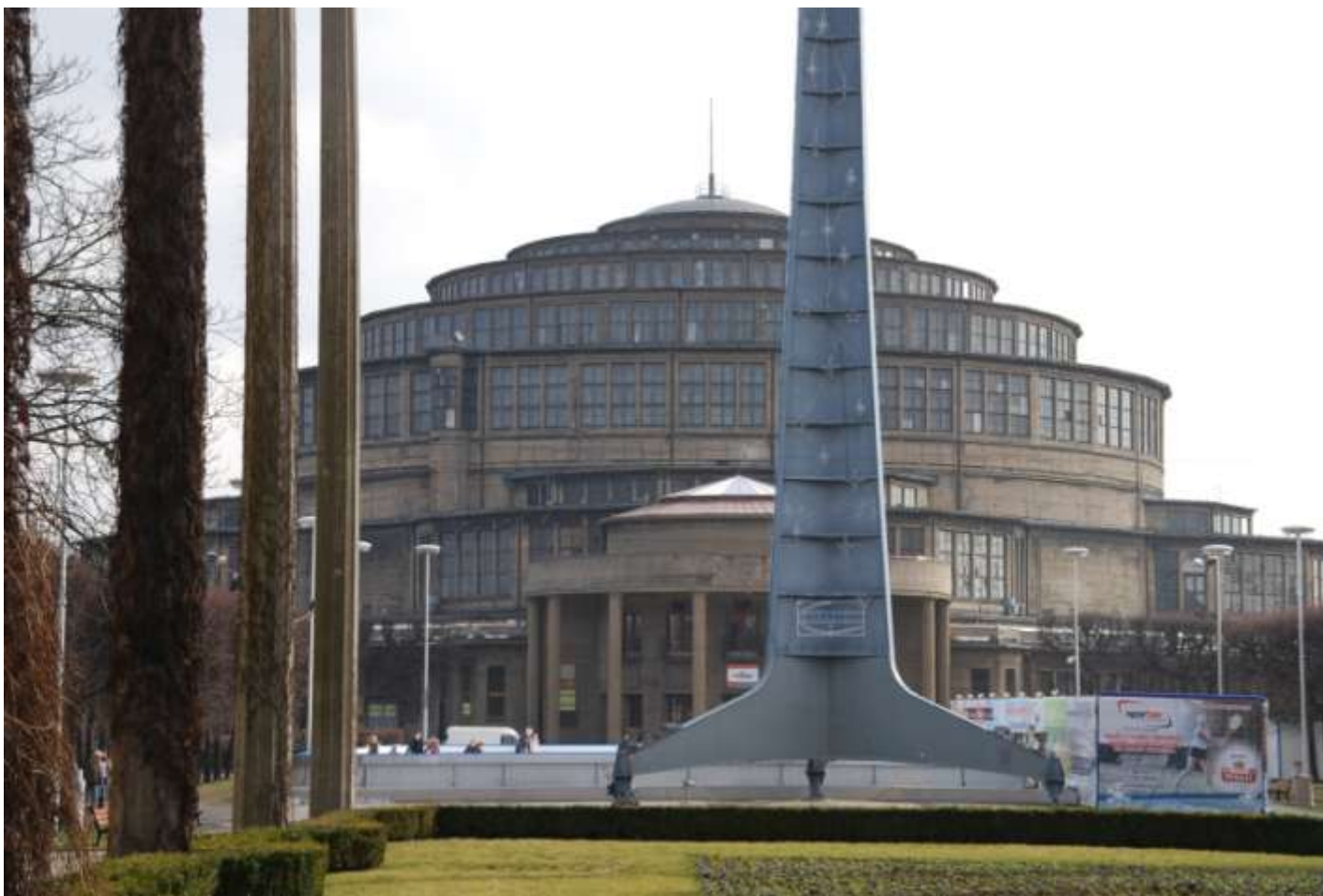
OBIEKT I ZAŁOŻENIE ZABYTKOWE – HALA STULECIA WE WROCŁAWIU Obiekt wpisany na listę światowego dziedzictwa