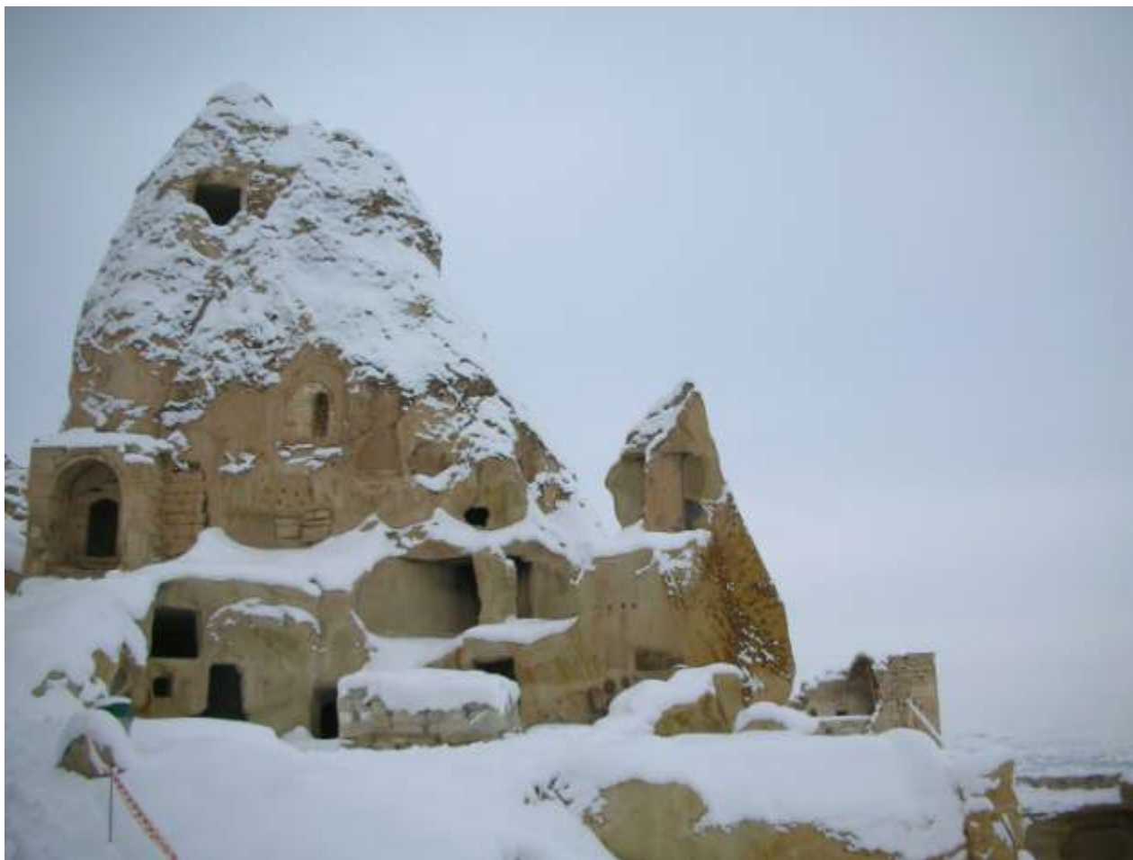
MIEJSCE ZABYTKOWE – GROTY W ANATOLII /TURCJA/