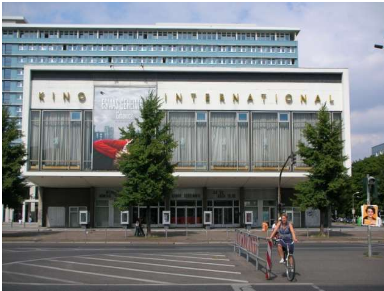
OBIEKTY ARCHITEKTURY WSPÓŁCZESNEJ JAKO ZABYTKI - KINO INTERNATIONAL W BERLINIE