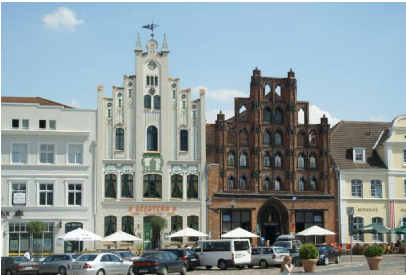
STARE MIASTO W WISMARZE PO REWALORYZACJI