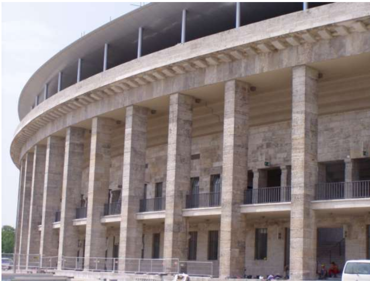
STADION OLIMPIJSKI W BERLINIE PO REWITALIZACJI