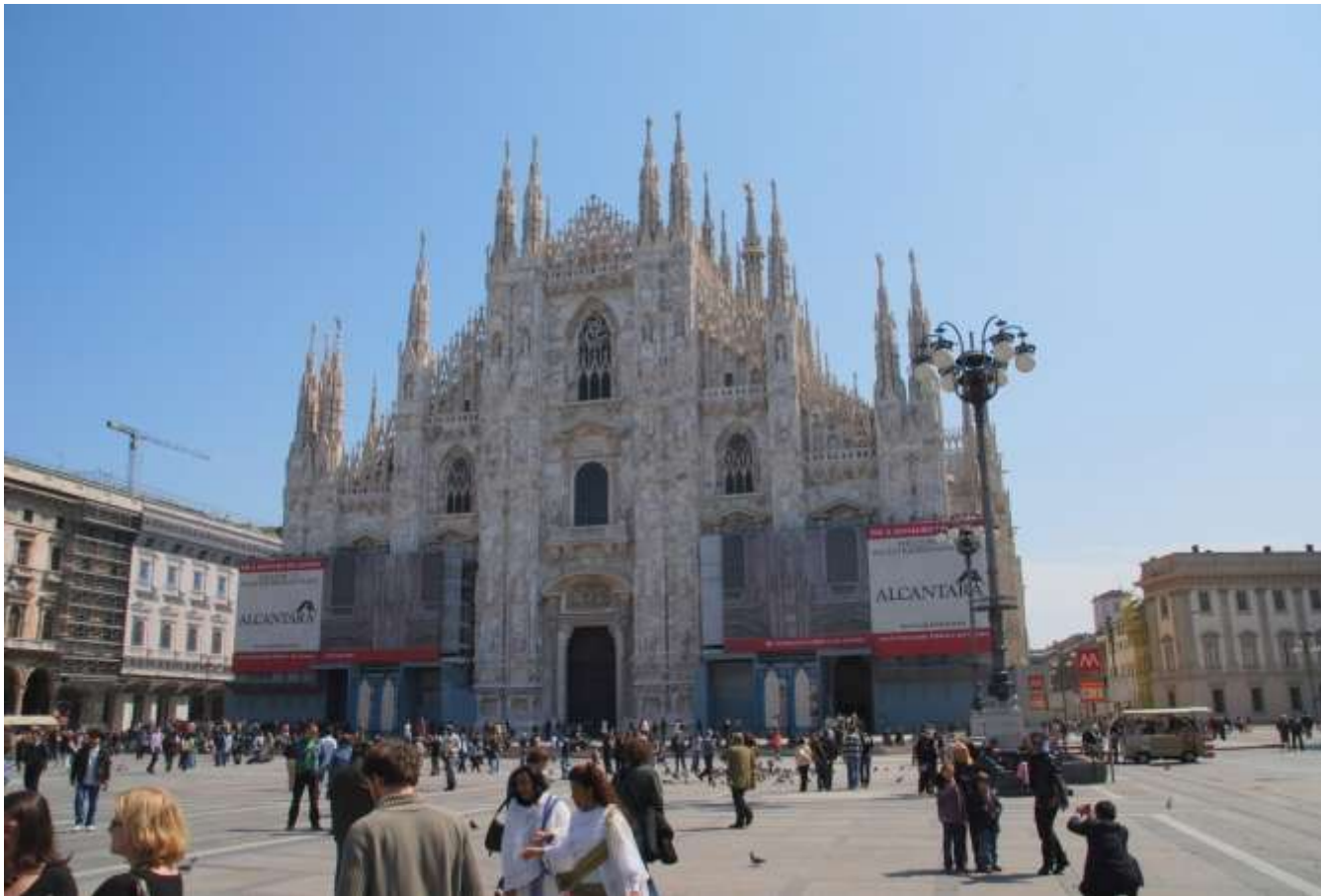
OBIEKT ZABYTKOWY – GOTYCKA KATEDRA W MEDIOLANIE